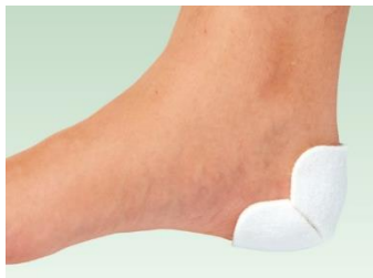
創傷面に合わせたカット例: 踵(左)、指先(右)