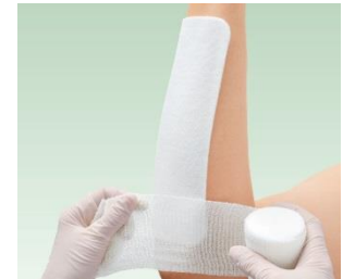
垂直や逆さな部位への貼付例

※4 シリコーンゲルメッシュ: 被覆された有孔加工物。患部に密着しながら、滲出液や血液を通します。