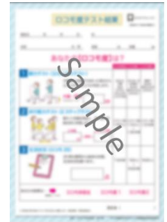
専用結果記入用紙