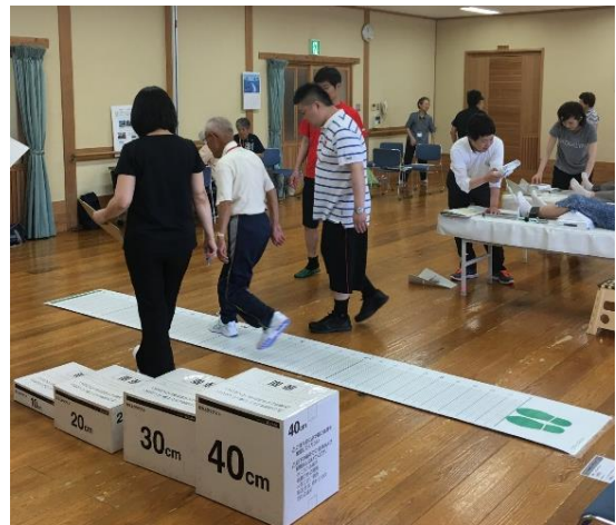
佐賀県の薬局のロコモ予防の取り組み

具体的な活動としては、「健康サポート薬局※6」の健康サポート機能、そして「かかりつけ薬剤師※7」の地域活動などが例に挙げられ、地域において住民の疾患予防や健康増進に貢献する役割が求められています。