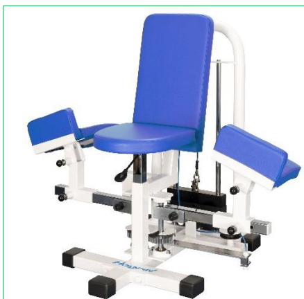
「インナーサイ S」全体写真(左)

今回の販売提携により、医科領域でアルケアが販売を担い、是吉興業は先進機器の開発と医科以外の領域での販売を担当します。