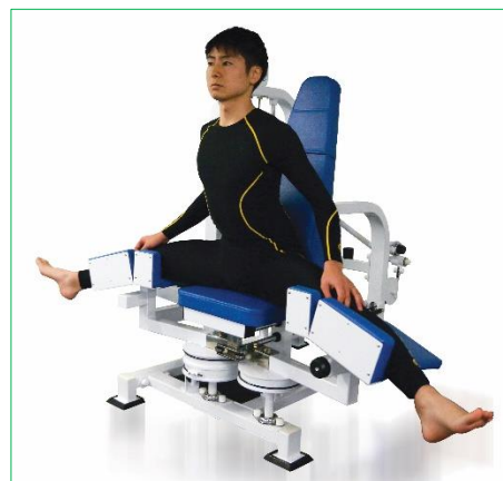
「インナーサイ」使用風景(右)