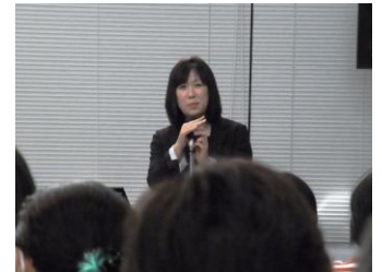
加瀬先生 講演風景

在宅看護に取り組む看護師として、病院、施設で症状が悪化した褥瘡の実例を挙げて治療から改善の道筋を示した。