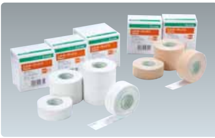
シルキーテックス Silkytex