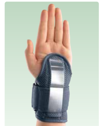
保持力のアップに

ステーカバーの中にアルミステーを入れて 使用し、手関節の動きを制限。マルチス トラップを手のひら側にとめることで、さらに 保持力がアップします。