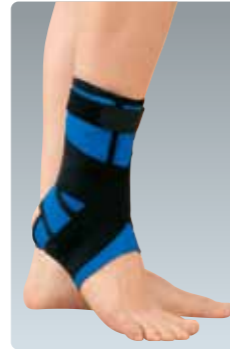
アンクルフィット Ankfit