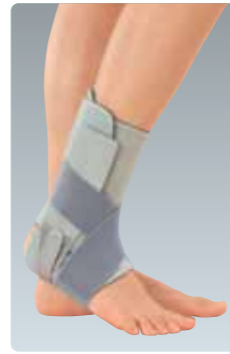
アンクルサポート Ankle-support