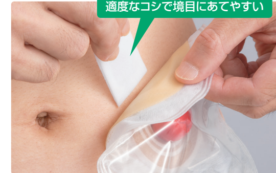
適度なコシで境目にあてやすい

ワイプシートに適度なコシがあり、使用時にヨレにくいので、ストーマ装具と皮膚の境に的確にシートをあてながら剥離できます。