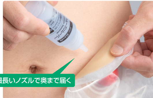
細長いノズルで奥まで届く

細長いノズルが、ストーマ装具の面板と皮膚の接着面の近くまで届くため、狙ったところへ簡単に滴下できます。