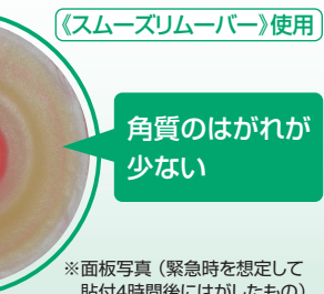
《スムーズリムーバー》使用