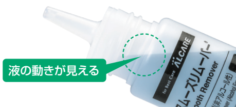
液の動きが見える

ボトル内の液の動きが見えるため、滴下のタイミングや残量がわかりやすくなっています。