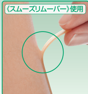
《スムーズリムーバー》使用