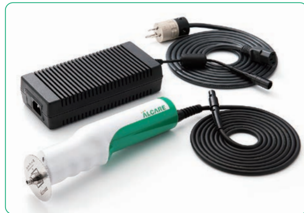
※必ずカット対象のキャスト材の添付文書をご確認のうえ、ご使用ください。