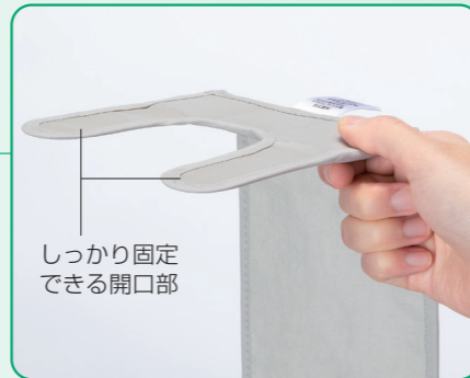
しっかり固定 できる開口部

開口部にはハードメッシュと合皮を使用。 伸縮しない材質なので、しっかりと面板を押さえられます。