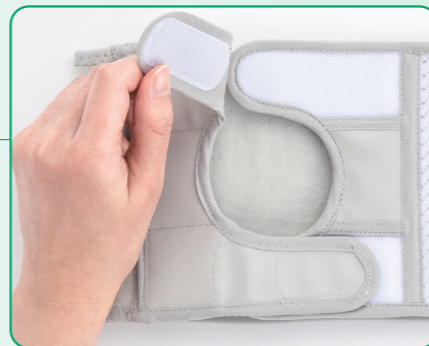
着脱可能な面ファスナー

2つの面ファスナーを使って空き部分を微調整できるので、 様々なストーマ装具にフィットした装着が可能です。