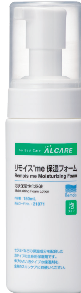
150mL / 1,210円(本体価格1,100円)