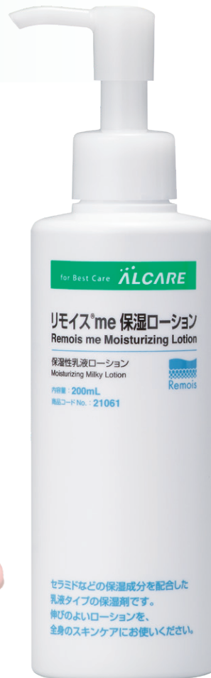
200mL / 1,078円(本体価格980円)