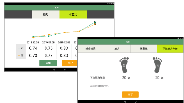
測定結果表示画面