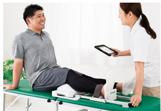
下肢筋力測定の様子

「人生100年時代」を楽しむために、本サービスが健康を望む人々とそれを支える事業者・団体とのタッチポイントづくりになれば幸いです。