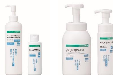
(左) リモイスラメラ保湿ミルク / (右) リモイス泡クレンズ