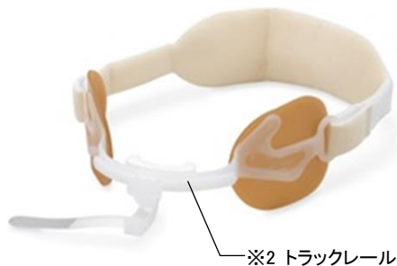
アンカーファスト