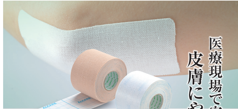
シルキーテックス