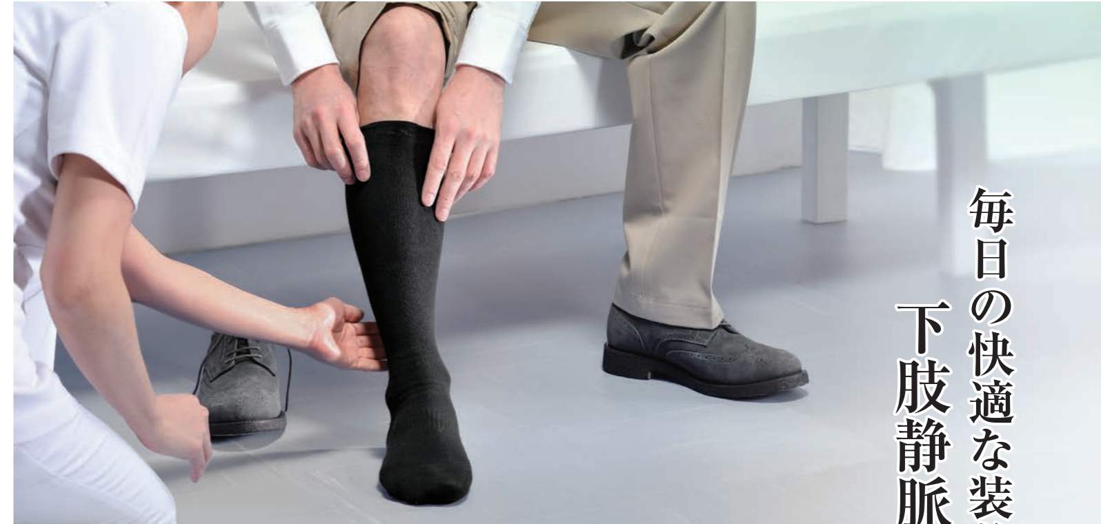
弾性ストッキング Elastic Stockings