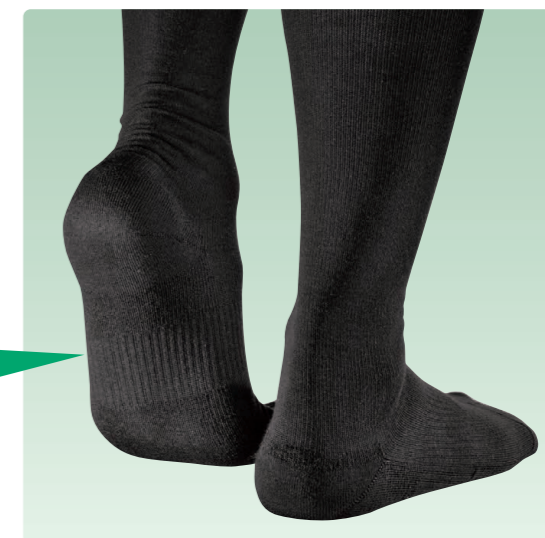
アーチ部は適度な圧迫をもたらす編み構造