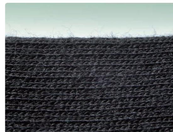
吸湿性に優れた綿混素材

靴下タイプだから性別を問わず履きやすく、日常生活のさまざまなシーンでお使いいただけます。また、綿混素材の採用により、従来のアンシルクシリーズと比較し、着用中のムレや滑りが低減されます。