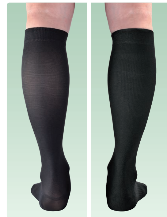
ストッキングタイプ