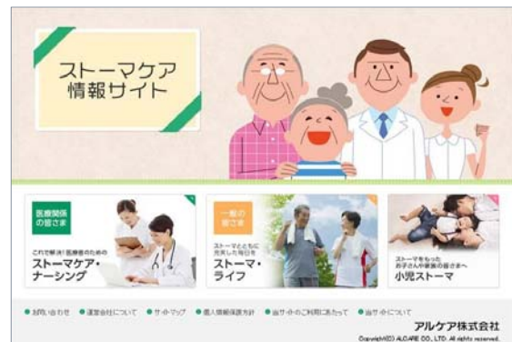
『ストーマ情報サイト』トップページ画面

そこでアルケアは、ケアに関わる多くの方が正確な情報を体系的に得られるよう、『ストーマケア情報サイト』を開設いたします。アルケアは、1955年に国産初の粘着式ストーマ装具「ラパック」開発以来、日本におけるストーマ装具のパイオニアメーカーとして独自の技術開発・製品開発を行ってきました。またケア情報サポート・心のケアといったカスタマーサービスを通じストーマ保有者の皆様とともに歩んでまいりました。ストーマケア事業50周年を機に、これまでになく情報サイトでストーマに関わる様々な方に貢献したいと考えております。