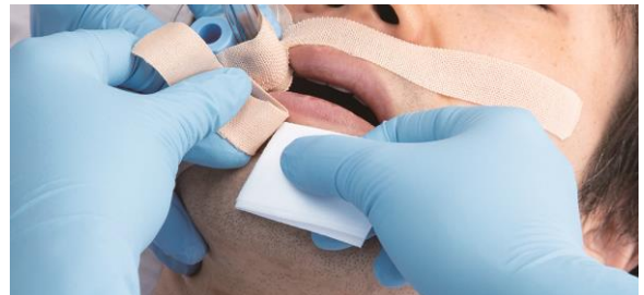
皮膚とテープの隙間に剥離液を染み込ませてはがします

なお、再び患者さんにテープで固定をする際に、「スムーズリムーバー ワイプシート」はシリコン系剥離液のサラッとした使用感のため、同じ場所にテープの貼り付けが可能となります。剥離～再固定の一連の処置がやさしく、スムーズに行えるため、医療従事者は適切なチューブ固定管理を実施することができます。