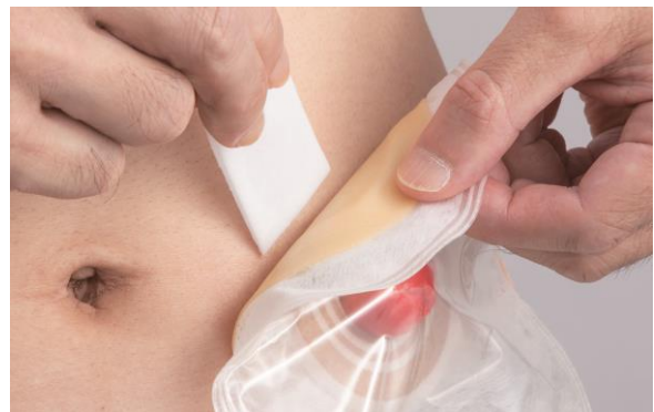
ストーマ装具と皮膚の間にスムーズリムーバーを当てながらストーマ装具をはがします

ストーマ装具交換の際に、「スムーズリムーバー ワイプシート」をあてながら剥離することで、より皮膚を傷めずにストーマ装具をはがすことができます。また、ワイプシートには適度なコシがあり、ヨレにくいいため、ストーマ装具と皮膚の境に的確にシートをあてやすくなっています。