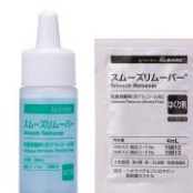
滴下ボトル(左)、 ワイプシート(右)

医療機関では医療機器取扱商社から、オストメイトの方は病院の売店や医療器械店などで購入できます。