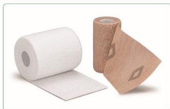
デュアプレス・テンションガイド Dualpress-Tension Guide