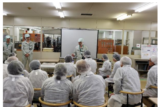
※2019年の1回目催行時の工場見学の様子