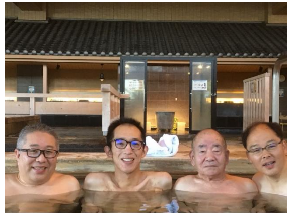
※2019年の1回目開催時の様子

アルケアは、創業以来「親切な製品をつくること」を志し、ケアをする人・ケアを受ける人の潜在的なニーズを察知して磨き抜かれた製品・情報・サービスを提供し、ケアの可能性を豊かにしていく「ベストケア」創造企業です。アルケアのストーマ領域では、国産初かつ唯一のストーマ装具メーカーとして、「オストメイトと共に歩み、自分らしいあしたを実現する」というミッションの実現を目指し、ストーマケアで必要とするストーマ装具だけでなく、日常生活をサポートする製品やサービスをカタチにして事業を展開しています。 ※1 ささまざまな病気や事故などにより、お腹に排泄のための「ストーマ（人工肛門・人工膀胱）」を造設した人